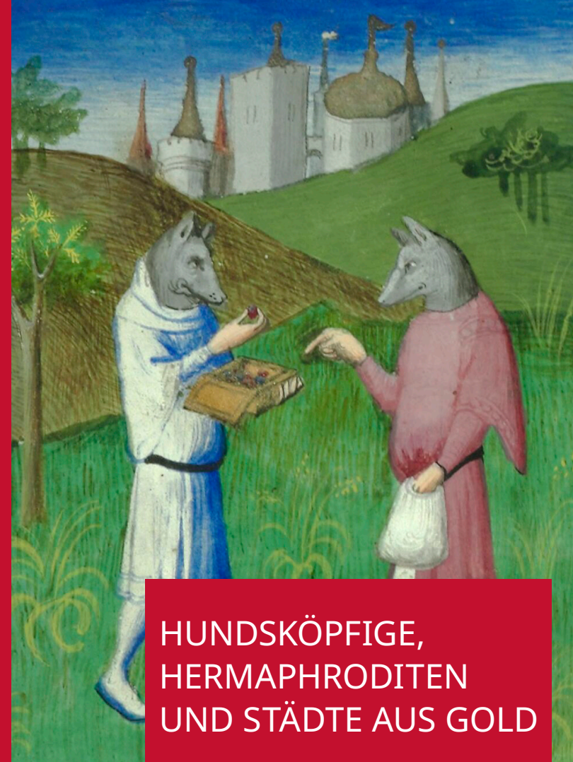
Abb.: BnF Fr2810, fol. 76v, https://creativecommons.org/licenses/by-sa/3.0

Ein Live-Stream wird zur Verfügung stehen. Den Link erhalten Sie auf Anfrage.